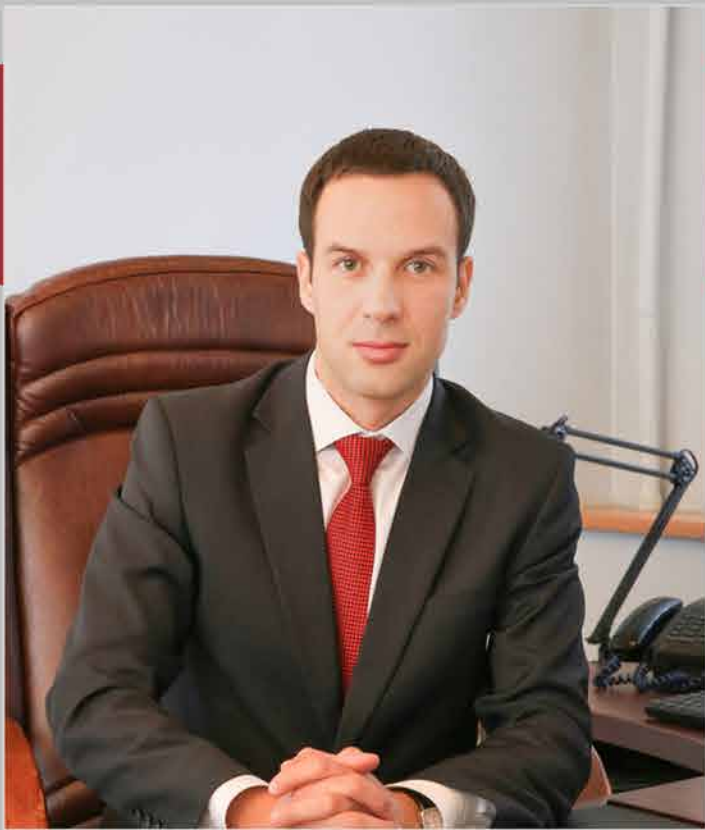
Директор Политехнического колледжа СахГУ